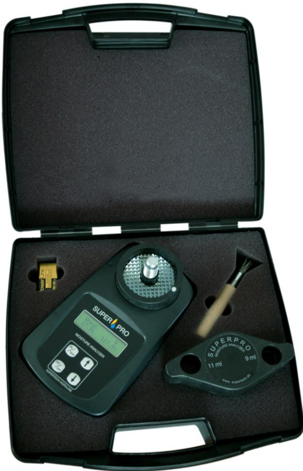
SuperPro – Getreidefeuchtemesser

Bei uns bekommen Sie die Getreidefeuchtemesser und Feuchtemesser für Heu, Stroh und Silage von der Firma SuperTech. Wir haben die Deutschland-Vertretung für die Geräte der Firma SuperTech bei diesen Geräten übernommen.