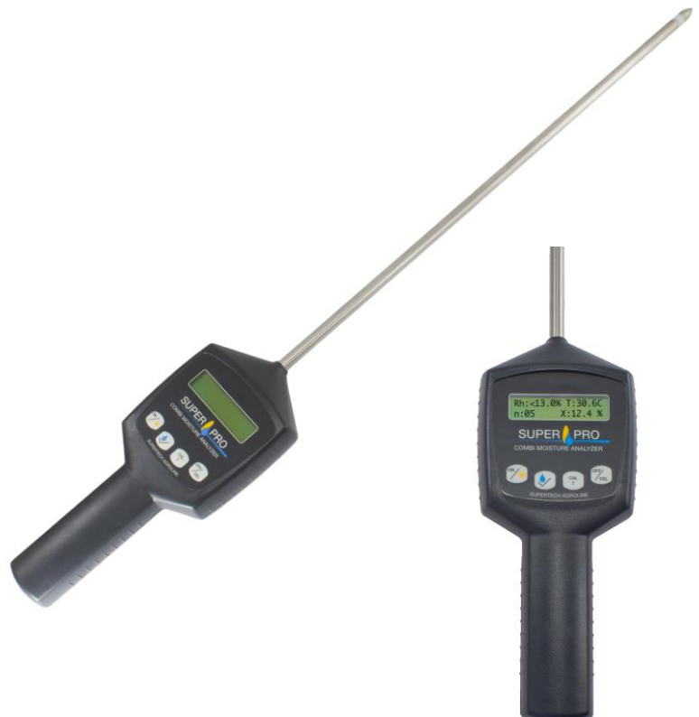
SuperPro- Combi Feuchtemesser für Stroh/Heu/Silage