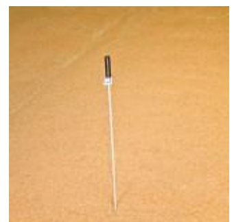
Temperaturmessstab für Getreide, Temperaturstab Getreide, Getreidetemperaturmessstab, Temperaturlanze Getreide