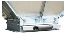
Auslauf mit Absperrschieber